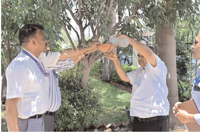
संस्थाओं, सहकारी बैंक शाखाओं, केवीएसएस एवं ग्राम सेवा सहकारी समितियों

जयपुर(कास)। भीषण गर्मी में बेजुबान पशु-पक्षियों को राहत पहुंचाने के उद्देश्य से सहकारिता विभाग ने प्रदेशभर में 'परिंडा बांधो अभियान' की शुरुआत की है। सहकारिता राज्य मंत्री (स्वतंत्र प्रभार) गौतम कुमार दक ने बुधवार को राजस्थान राज्य सहकारी बैंक (अपेक्स बैंक) परिसर में परिंडा बांधो अभियान का शुभारंभ किया। अभियान के तहत विभागीय कार्यालयों, सहकारी