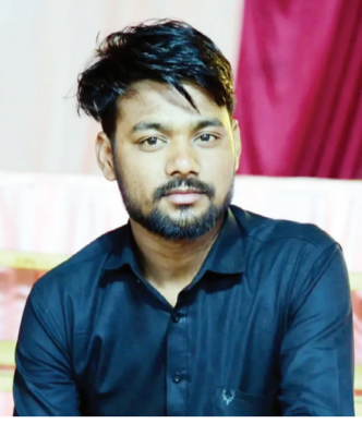
साथ निमाणा घांरे के पास स्थित एक खेत में पार्टी करने गया था। बताया जा रहा है कि पार्टी