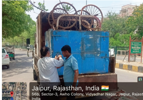
Jaipur, Rajasthan, India 56b, Sector-3, Awho Colony, Vidyadhar Nagar, Jaipur, Rajasthan