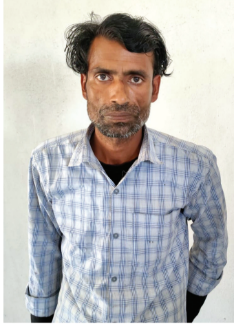
अपराधियों की धरपकड़ अभियान के तहत