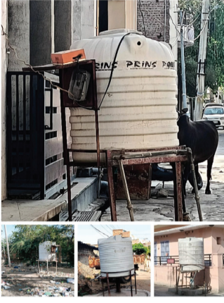
अनुसार आधा शहर मीणा आधा सुखा मतलब राजनीतिक तथा वोट बैंक का खेल

सुमेरपुर(निस)। नगर पालिका की पेयजल व्यवस्था अब शहर के लिए रहत नहीं, बल्कि सवाल बनकर खड़ी हो गई है। लाखों रुपए खर्च कर लगाए गए सार्वजनिक पानी के टैंक आज या तो सूखे खड़े हैं या कचरे में दबकर बदहाली की गवाही दे रहे हैं। हालात इतने बिगड़ चुके हैं कि शहर के 36 वार्डों में पानी का वितरण पूरी तरह असंतुलित और संदिग्ध नजर आ रहा है। शहरवासियों का सीधा आरोप है—पालिका ने पेयजल जैसी मूलभूत सुविधा में भी भेदभाव की नीति अपना ली है। कुछ वार्डों में टंकियां पानी से लबालब हैं, जबकि निचले और पिछड़े इलाकों में कनेक्शन तक काट दिए गए हैं। प्राप्त जानकारी के