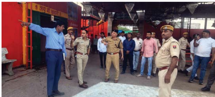
मौजूद पुलिस एवं प्रशासनिक अधिकारियों को निर्देश दिए कि मेले में आने वाले श्रद्धालुओं को दर्शन के दौरान किसी प्रकार की असुविधा न हो तथा यातायात व्यवस्था