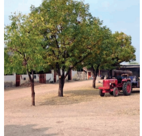
गौशाला भविष्य में गौसंरक्षण का आदर्श मॉडल बनकर उभरेगी।