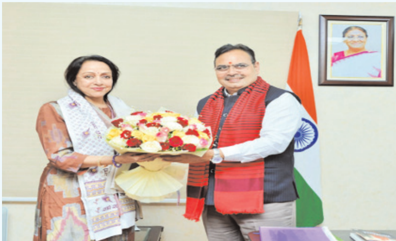
और अन्य फिल्म जगत से जुड़े बड़े निर्माता और कलाकार लगातार मुख्यमंत्री भजनलाल शर्मा से

जयपुर(कासं.) मुख्यमंत्री भजनलाल शर्मा और मधुरा से भाजपा सांसद हेमा मालिनी के बीच शनिवार को जयपुर में मुलाकात हुई दोनों नेताओं के बीच कई बड़े मुद्दों को लेकर आपस में चर्चा हुई दोनों नेताओं ने एक दूसरे से पूरे आदर भाव और सम्मान के साथ हाथ मिलाया और फिर राजस्थान से जुड़े कई मुद्दों को लेकर दोनों के बीच काफी देर तक बातचीत हुई। बताया जा रहा है कि दोनों नेताओं के बीच जयपुर में फिल्म उद्योग, पर्यटन, सांस्कृतिक विरासत इत्यादि मुद्दों को लेकर ज्यादा चर्चा हुई है क्योंकि पिछले कुछ महीनों में फिल्म जगत से जुड़े कई बड़े कलाकार मुख्यमंत्री भजनलाल शर्मा से मुलाकात कर चुके हैं अक्षय कुमार ने भी कुछ महीने पहले भजनलाल शर्मा से मुलाकात की थी इसके अलावा कैसी बोकाडिया