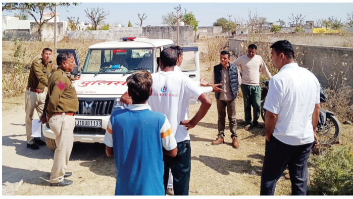
अलग-अलग कमरों की बाहर से कुंडी लगाकर वारदात को अंजाम दिया। इसके