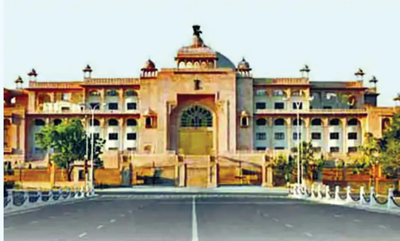
प्रणाली की प्रभावी निगरानी करना है धराजस्थान विधानसभा में उपमुख्यमंत्री प्रेमचंद बेरवा ने