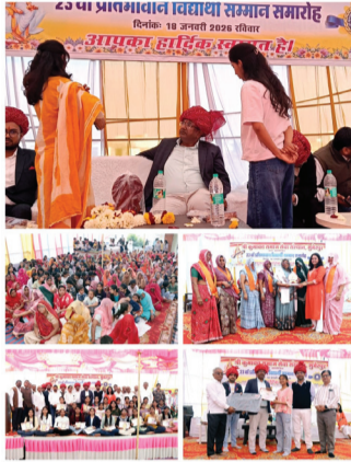
अलावा खेलों, संगीत, विज्ञान के क्षेत्र में भी