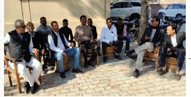
माहौल बनाने के लिए प्रचार तेज कर दिया है।