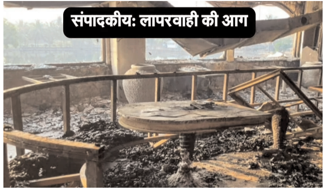
संपादकीय: लापरवाही की आग