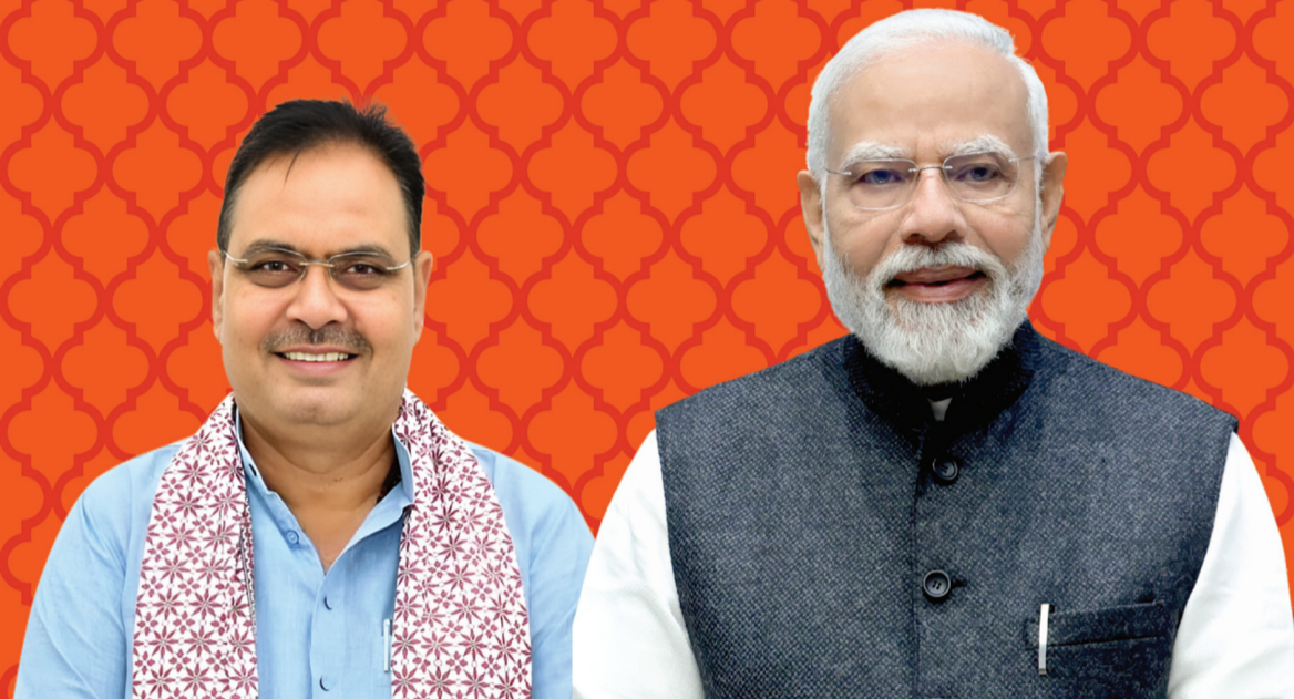
श्री भजन लाल शर्मा माननीय मुख्यमंत्री, राजस्थान