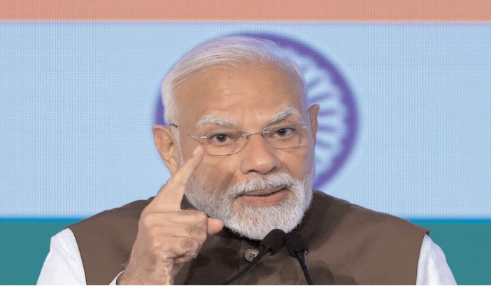
बदलाव कर वीवी-जीरामजी नामक जो नया कानून लाया गया, उसके कितने सकारात्मक

प्रधानमंत्री मोदी ने वर्ष 2025 को सुधारों के वर्ष के रूप में रेखांकित करते हुए यह जो कहा कि भारत रिफॉर्म एक्सप्रेस पर सवार हो गया है और इससे 2047 तक देश को विकसित बनाने के प्रयासों को मजबूती मिलेगी, उसकी सार्थकता तभी है, जब वास्तव में ऐसा होता हुआ दिखाई देगा। इससे इन्कार नहीं कि इस वर्ष कई बड़े सुधार हुए, जिनमें सबसे उल्लेखनीय रहा जीएसटी में व्यापक बदलाव। इसके अतिरिक्त बीमा क्षेत्र में सौ प्रतिशत विदेशी पूंजी निवेश को मंजूरी देने और श्रम सुधारों के तहत 29 कानूनों को चार आधुनिक कोड में समेटकर लागू करने को भी बड़े कदम की संज्ञा भी दी जा सकती है, लेकिन अभी तो इन सुधारों का प्रभाव सामने आना शेष है। ठीक वैसे ही, जैसे इसका पता भविष्य में ही चलेगा कि मन्नेगा में बुनियादी