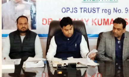
ने आरोप लगाया कि ये लोग पुराने एजेंटों के माध्यम से फर्जी डिग्री व मार्कशीट छपाकर बेचने का प्रयास कर रहे हैं और कर्मचारियों का एजेंट बनकर लोगों को गुमराह कर करोड़ों रुपए वसूल चुके हैं।