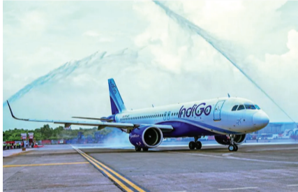
नई दिल्ली/जयपुर टाइम्स

फ्लाइट लेट तो खाना और रिफंड पक्का: उड़ान रद्द होने पर सरकार की नई एडवाइजरी