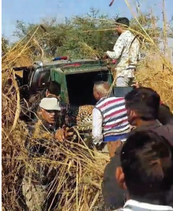
गई। करीब एक घंटे की मशकत के बाद टीम को सफलता मिली। लेपर्ड की पहली

लक्ष्मणगढ़(निस)। क्षेत्र में करीब 10 से 12 दिनों से दहशत का कारण बने लेपर्ड को वन विभाग की टीम ने सोमवार को सनवाली गांव से सकुशल रेस्क्यू कर लिया। जयपुर से आई वन विभाग की विशेष टीम और लक्ष्मणगढ़ वन विभाग के संयुक्त प्रयास से दोपहर करीब 12 बजे लेपर्ड को ट्रैक्यूलाइज कर पिंजरे में बंद किया गया। इसके बाद लेपर्ड को लक्ष्मणगढ़ वन विभाग कार्यालय ले जाया गया। वन विभाग के अनुसार, सोमवार सुबह से ही टीम लेपर्ड के पदचिह्नों का पीछा करती हुई सनवाली गांव पहुंची। एक खेत में लेपर्ड के छिपे होने की सूचना मिलने पर तत्काल खेत की घेराबंदी की