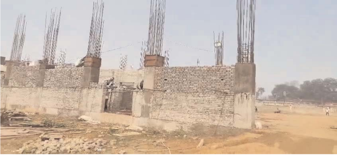
रिसेशन कार्यालय तथा दिव्यांग खिलाड़ियों के लिए पृथक विशेष शौचालय का निर्माण भी किया जा रहा है। लगभग 12म15 आकार

धौलपुर(निस.) । जिले के खेल प्रेमियों और खिलाड़ियों के लिए खुशखबरी है। खिलाड़ियों की लंबे समय से चली आ रही मांग अब साकार होती दिख रही है। सरकार द्वारा स्वीकृत इंडोर हॉल के निर्माण कार्य की शुरुआत हो गई है और कार्य तेज गति से जारी है। अनुमान है कि आगामी फरवरी माह तक धौलपुर के खिलाड़ी इंडोर गेम्स की आधुनिक सुविधाओं का लाभ उठा सकेंगे। इंदिरा गांधी स्टेडियम की बड़ी फील्ड में यह अत्याधुनिक इंडोर हॉल बनाया जा रहा है। गत वर्ष राज्य सरकार द्वारा इस परियोजना के लिए 5 करोड़ रुपये स्वीकृत किए गए थे। योजना के तहत 27म45 मीटर का बहुउद्देशीय हॉल तैयार किया जा रहा है। इसके साथ ही खिलाड़ियों के लिए दो चॉजिंग रूम, संलग्न शौचालय, एक