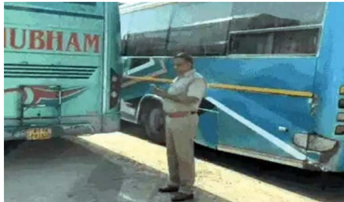
विभाग की विस्तृत जांच में सामने आया कि झुंझुनू जिले में भारी वाहनों की स्थिति सड़क सुरक्षा के लिहाज से बेहद चिंताजनक थी। जिले में पंजीकृत वाहन: जिले में डंपर, ट्रक, ट्रैक्टर और अन्य लोडिंग वाहन करीब 1700