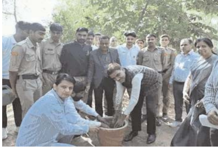
के महत्व को अधिक से अधिक जन प्रभावी बनाने के लिए प्रयास करना आज समय की मांग है। हमें पारंपरिक ज्ञान को आधुनिक संदर्भ में स्थापित कर भावी पीढ़ी के लिए