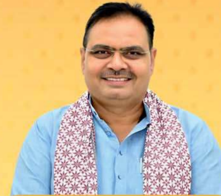
श्री भजनलाल शर्मा माननीय मुख्यमंत्री