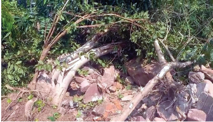
लाम पहुंचाने के उद्देश्य से इस भूमि का आवंटन किया। भवन निर्माण के लिए

धौलपुर(नि.सं.) में राजस्थान आवासन मंडल ने पीडब्ल्यूडी से विवादित भूमि का कुछ लोगों को आवंटन कर दिया। इस विवादित भूमि पर खड़े 90 से अधिक हरे पेड़ों को काटने के लिए आवासन मंडल ने गलत तथ्य दिखाकर तहसीलदार से अनुमति प्राप्त की। इसके बाद बुधवार को जेसीबी की मदद से सभी फलदार पेड़ काट दिए गए, जिसका स्थानीय लोगों ने विरोध किया। स्थानीय निवासियों के अनुसार, बाड़ी रोड पर महिला धाने के सामने स्थित भूमि पीडब्ल्यूडी और आवासन मंडल के बीच कोर्ट में विवादित है। आरोप है कि आवासन मंडल ने कुछ भूमाफियाओं और नेताओं को