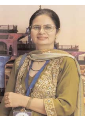
(PMS) प्रीमैस्ट्रुएल सिंड्रोम कहते हैं। लेकिन उसे समझा नहीं जाता है।

मानसिक स्वास्थ्य व्यक्ति के संपूर्ण स्वास्थ्य का महत्वपूर्ण हिस्सा है लेकिन यह विषय अक्सर अनदेखा किया जाता है या फिर महसूस ही नहीं किया जाता है। विशेष रूप से महिलाओं के संदर्भ में महिलाओं को कई ऐसे मानसिक सामाजिक व शारीरिक समस्याओं का सामना करना पड़ता है जो उनके मानसिक स्वास्थ्य को प्रभावित करती हैं। महिलाओं के जीवन में हार्मोनल बदलाव एक सामान्य प्रक्रिया है। मासिक धर्म से पहले चिंता, धकान जैसे समस्याएं आती हैं जिन्हें