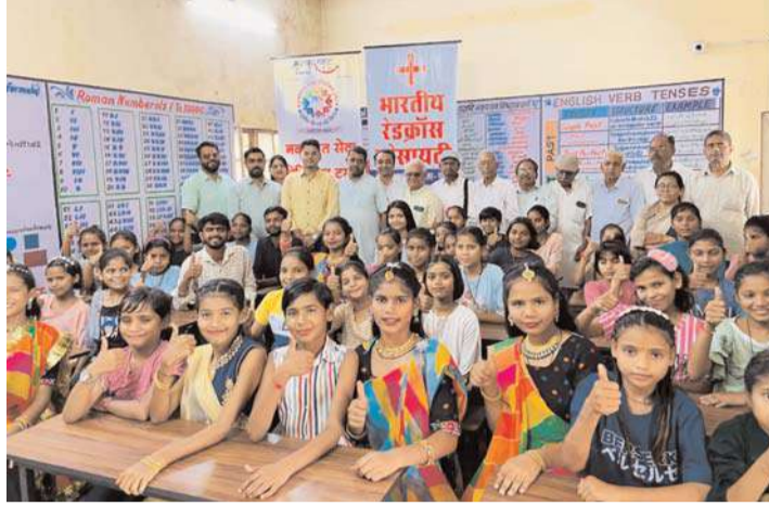
पुराड़ी (सुमेरपुर) में अध्ययनरत बालिकाओं को पढ़ने और बैठने के लिए 28 टेबल व

सुमेरपुर(निस.)। भारतीय रेडक्रॉस सोसायटी एवं नवभारत सेवा चोरिटेबल ट्रस्ट की प्रेरणा से रिदम मेकओवर सुमेरपुर द्वारा राजकीय कस्तूरबा गांधी बालिका आवासीय विद्यालय