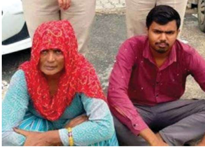
लिए काफी समय से फरार चल रहे थे। इससे पहले, पुलिस इस मामले में पांच अन्य