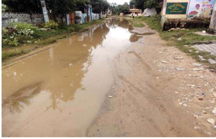
माध्यमिक विद्यालय से लेकर शिव मंदिर के आगे तक सीसी सड़क मार्ग का निर्माण